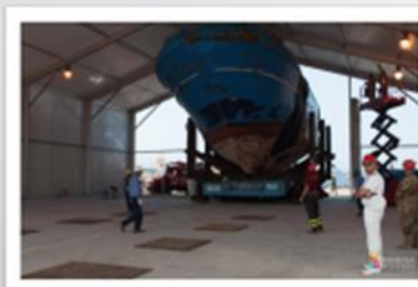
Base Nato Melilli 2016 – Peschereccio affondato nel naufragio del 18 Aprile 2015