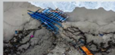
Cutro 2023 – Peschereccio affondato nel naufragio del 26 febbraio 2023